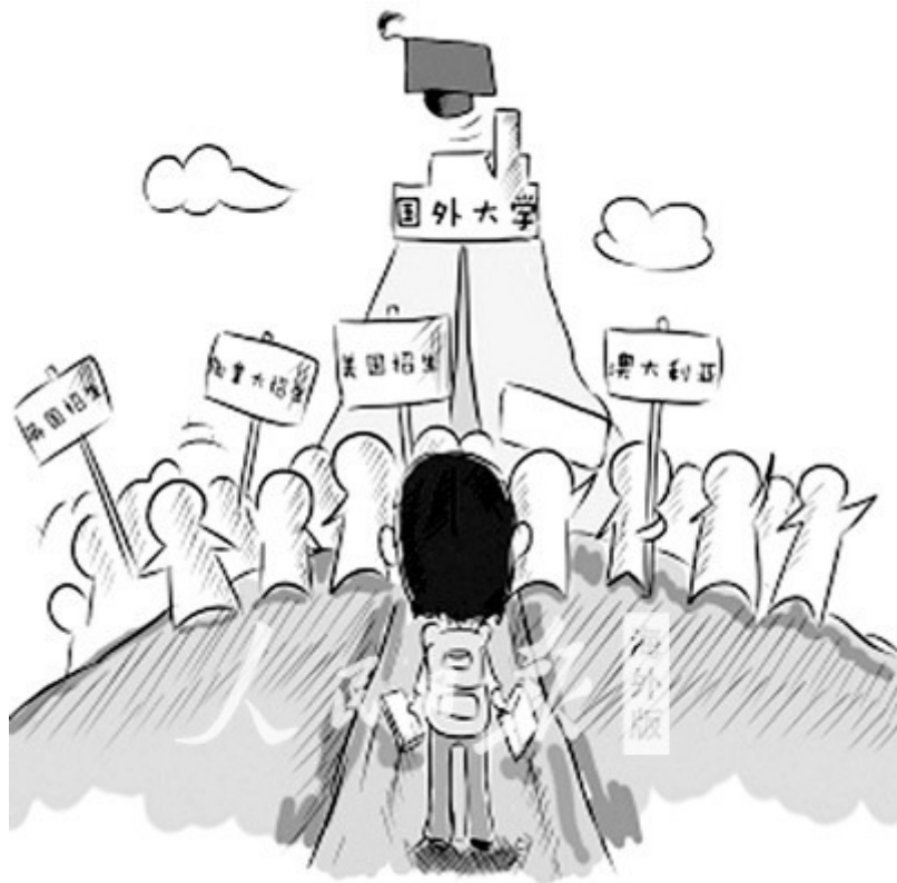
陈骁绘 《人民日报海外版》（2012年12月21日 第06版）