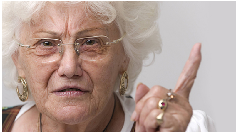
Die einstigen Babyboomer werden ihre Macht einsetzen und den Nachkommen immer mehr Lasten aufbürden.

Noch ahnen die Babyboomer nicht, was ihnen blüht, weil sie von einer glücklichen und historisch einmaligen Konstellation profitieren. Noch nie hat es in der Geschichte Deutschlands eine Gruppe von 50-Jährigen gegeben, die relativ gesehen so wenige alte und junge Menschen miternähren musste wie heute. Vorläufig wird es sie auch nie wieder geben. Die Finanzierung der Eltern können sich die Babyboomer mit ihren vielen Geschwistern teilen, und die Finanzierung der Kinder entfällt mangels Masse. Deshalb bleibt viel Geld für einen beispiellosen Konsumstandard übrig. Aber das schöne Leben wird in etwa 15 Jahren jäh in Verzweiflung umschlagen, wenn alle Babyboomer gleichzeitig in die Rente gehen und von Kindern ernährt werden wollen, die es nicht gibt. Der Sturz vom Konsumhimmel in die Altersarmut wird jäh, tief und schmerzlich sein.